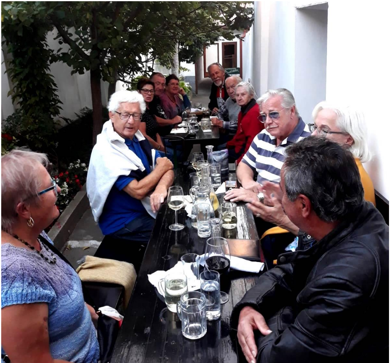
Mittwoch 22.9. Bei der Weiterfahrt machten wir zuerst in Eggenburg Station